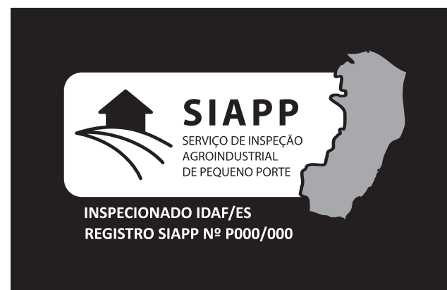
Aplicação em negativo (Branco e 40% Black)