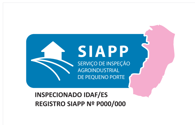
Aplicação em cores