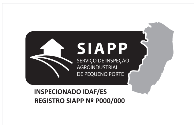
Aplicação em uma cor (100% Black e 40% Black)